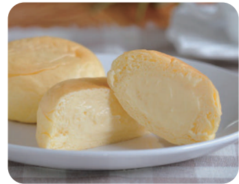
くりーむパン(カスタード)